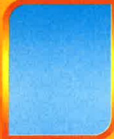
ว่าง พนักงานจ้างทั่วไป