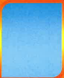
ว่าง นักวิชาการสาธารณสุข