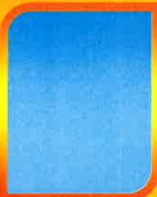
ว่าง หัวหน้าฝ่ายการโยธา