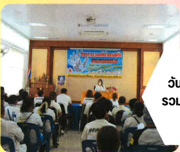
วันที่ 26 มิถุนายน 2566 จัดโครงการ รณรงค์ต้านยาเสพติดโลก ประจำปีงบประมาณ 2566