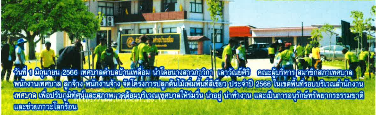
วันที่ 1 มิถุนายน 2566 เทศบาลตำบลบ้านเหลื่อม นำโดยนางสาวภวิภา เลาวณิชย์ศิริ คณะผู้บริหาร สมาชิกสภาเทศบาล พนักงานเทศบาล ลูกจ้าง พนักงานจ้าง จัดโครงการปลูกต้นไม้เพิ่มพื้นที่สีเขียว ประจำปี 2566 ในเขตพื้นที่รอบบริเวณสำนักงาน เทศบาล เพื่อปรับภูมิทัศน์และสภาพแวดล้อมบริเวณเทศบาลให้ร่มรื่น น่าอยู่ น่าทำงาน และเป็นการอนุรักษ์ทรัพยากรธรรมชาติและช่วยภาวะโลกร้อน