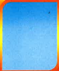
ว่าง พนักงานจ้างทั่วไป