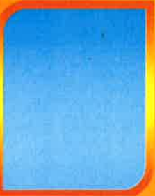
ว่าง นายช่างโยธา