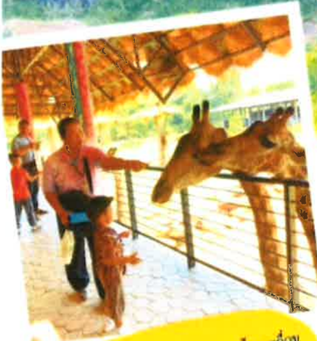
ศูนย์พัฒนาเด็กเล็กเทศบาลตำบลบ้านเหลื่อม จังหวัด กสภราชศึกษา เทศบาลตำบลบ้านเหลื่อม