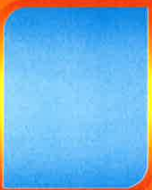
ว่าง เจ้าพนักงานป้องกันและบรรเทาสาธารณภัย