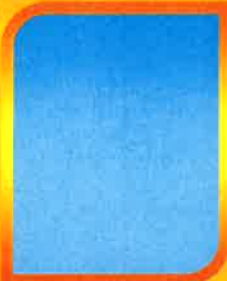
ว่าง หัวหน้าฝ่ายบริหารการศึกษา