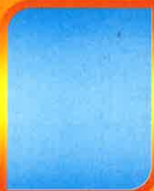
ว่าง นิติกร