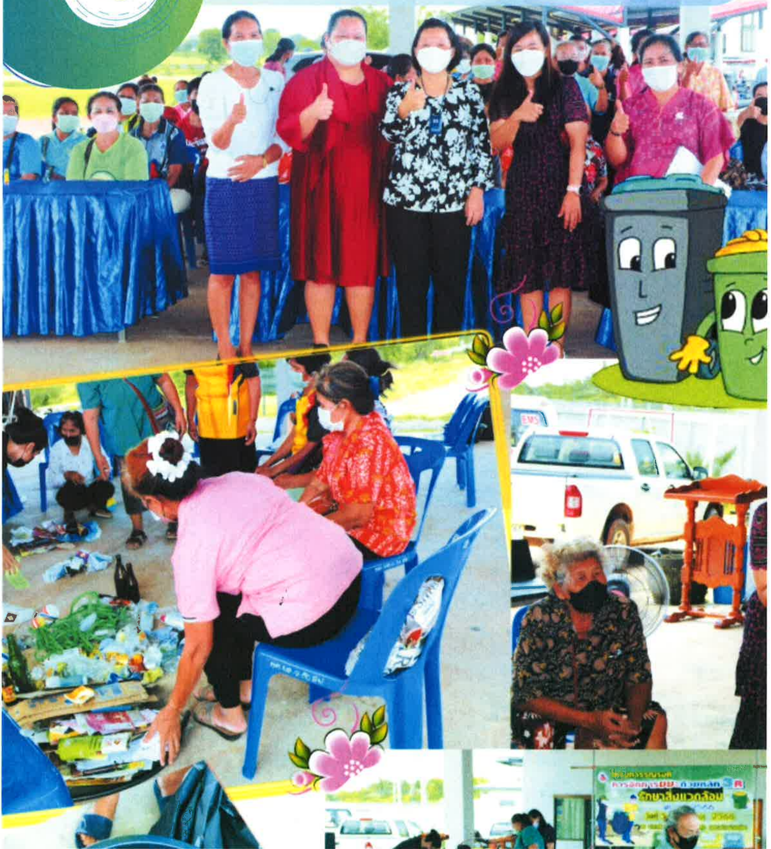
วันที่ 30 พฤษภาคม 2566 จัดโครงการรณรงค์การจัดการขยะด้วยหลัก 3R ปีงบประมาณ 2566