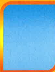
ว่าง หัวหน้าฝ่ายบริหารงานสาธารณสุข